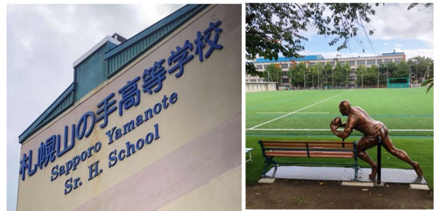
札幌山の手高校の部活動は長い伝統と高い実績を持つことで知られています

「学校応援電力」はワタミエナジーの「ワタミの電気」が実施する新たなサービスで、学校の卒業生・教職員・在校生世帯など、学校を応援していただける方に向けた電力サービスです。「学校応援電力」に電気を切替えることで、学校のクラブ活動などの応援ができるとともに、電気料金そのものがお得になるといった特典も得られます。「学校応援電力」はワタミグループが取り組んでいる持続可能な循環型社会づくりに貢献することを目的に推進してまいります。札幌山の手高校では「学校応援電力」によってクラブ活動への応援資金が増えるだけでなく、母校を応援したいといった卒業生や在校生の気持ちにこたえていきます。